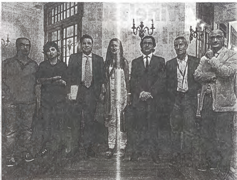
Miembros del jurado y el concejal de Cultura de Santander (en el centro), ayer en La Magdalena.