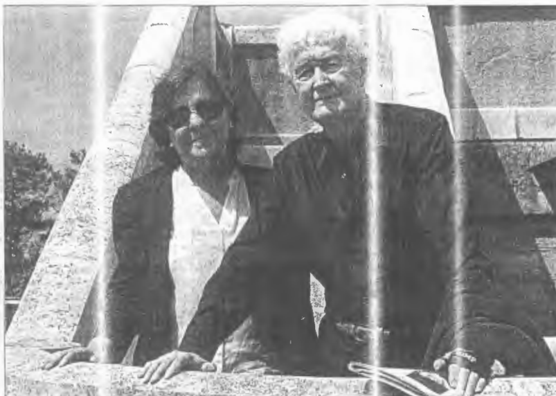
La premiada, Carmen Linares, y el flamencólogo, Félix Grande, en la UIMP.